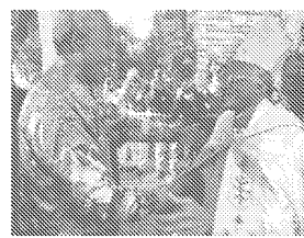
Desmond Tutu und Nelson Mandela vor der Kathedrale in Kapstadt: 1996 trat Tutu als Erzbischof zurück. Er blieb aber bis heute ein unbequemer Beobachter des neuen Südafrika.