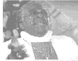
Desmond Tutu bei einem Begräbnis in Soweto: Der 1931 geborene Tutu wurde in den 70er-Jahren zu einem der bekanntesten Kritiker der Politik der Rassentrennung in Südafrika.