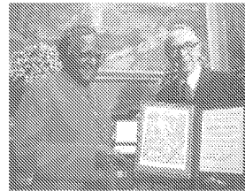
Desmond Tutu mit dem Präsidenten des Nobelpreiskomitees: 1984 erhielt Tutu den Friedensnobelpreis für sein Engagement gegen die Apartheid, die 1992 schliesslich abgeschafft wurde.